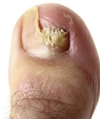
نمونه ای از ناخن قارچی

به دنبال مقاله هفته گذشته در مورد سایر بیماری های که ناخن پا به آن مبتلا می گردد، در این مقاله در مورد قارچ ناخنی که در زبان انگلیسی به آن Nail Fungus و در اصطلاح علمی به آن Onychomycosis می گویند سخنی چند خدمت هم میهنان عرض می کنم. قارچ ناخن گوناگونی بسیار دارد ولی نوع بخصوص آن که باعث بیش از ۷۰٪ آلودگی و صدمات قارچی می شود تی روبرم ( T. Rubrum ) نام دارد که از پوست، مو و ناخن تغذیه می کند که منجر به آلودگی نه تنها ناخن پا بلکه پوست و غشاء اطراف ناخن و در نوع شدید آن باعث آلودگی گوشت زیر ناخن ( Nail Bed ) هم می گردد. در این صورت ناخن دفرومه شده، ضخیم، خورد خورد و پودری، شکننده، تیره و بدبو شده و از تخت ناخن جدا می گردد که علاوه بر عواقب و ریسکهای فیزیکی مانند شکسته شدن، درد و عفونت از جوانب نامطلوب روحی مانند انزوا و خجالت زدگی هم برخوردار است.